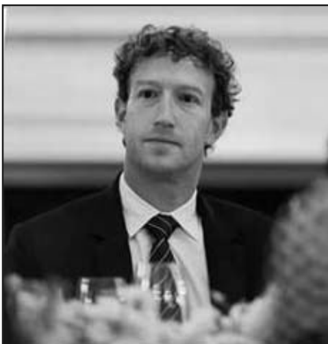
ਦਾ ਨਤੀਜਾ ਸੋਸ਼ਲ ਮੀਡੀਆ ਦੂਜੇ ਪਾਸੇ, Meta ਦੇ ਬੁਲਾਰੇ

ਲੌਸ ਐਂਜਲਸ: ਸੋਸ਼ਲ ਮੀਡੀਆ ਦਿੱਗਜ Meta ਦੇ CEO ਮਾਰਕ ਜ਼ਕਰਬਰਗ ਇੱਕ ਵੱਡੀ ਕਾਨੂੰਨੀ ਮੁਸ਼ੀਬਤ 'ਚ ਫ਼ਸ ਗਏ ਹਨ। ਬਚਪਨ ਤੋਂ ਫੇਸਬੁੱਕ ਦੀ ਵਰਤੋਂ ਕਰਨ ਵਾਲੀ ਇੱਕ 20 ਸਾਲਾ ਮੁਟਿਆਰ ਵਲੋਂ ਪਾਏ ਗਏ ਮੁਕੱਦਮੇ 'ਤੇ ਕਾਰਵਾਈ ਕਰਦਿਆਂ ਅਦਾਲਤ ਨੇ ਜ਼ਕਰਬਰਗ ਨੂੰ ਜਵਾਬ ਦੇਣ ਲਈ ਤਲਬ ਕੀਤਾ ਹੈ। ਪੀੜਤ ਮੁਟਿਆਰ ਦਾ ਦਾਅਵਾ ਹੈ ਕਿ ਸੋਸ਼ਲ ਮੀਡੀਆ ਦੀ ਬਹੁਤ ਜ਼ਿਆਦਾ ਵਰਤੋਂ ਕਾਰਨ ਉਸ ਨੂੰ ਇਸ ਦੀ ਆਦਤ ਲੱਗ ਗਈ ਜਿਸ ਕਾਰਨ ਉਹ ਡਿਪ੍ਰੈਸ਼ਨ (ਮਾਨਸਿਕ ਤਨਾਅ) ਅਤੇ ਖ਼ੁਦਕੁਸ਼ੀ ਵਰਗੇ